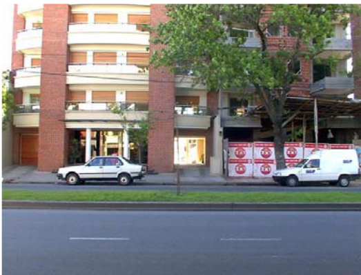
VISTA DE UN EDIFICIO TÍPICO

2 CORTE DESDE EL EXTERIOR : SE PODRA PROCEDER A SUSPENDER EL SUMINISTRO EN CUALQUIER MOMENTO, SIN ACCEDER A LA SALA DE MEDIDORES. PARA ELLO LOS MEDIDORES TENDRAN ADOSADOS UN RELE DE CORTE, DE LA CORRIENTE ESPECIFICADA POR LA EMPRESA , DE ACUERD AL TIPO DE CONSUMO DE CADA CLIENTE. EL CORTE SE HARA POR MEDIO DE LA LAPTOP , Y EN FORMA RAPIDA . EN LA COMPUTADORA SE PODRA ACCEDER AL ESTADO DE LOS MEDIDORES, SIN NECESIDAD DE REALIZAR NINGUNA OPERACIÓN. ( SUPERVISIÓN )